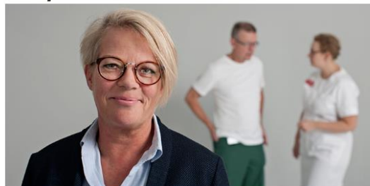
Introduktion for ledere