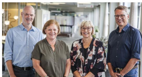
Velkomst fra Direktionen

For at komme ind på internetsiden, klik på billedet nedenfor: