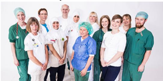
Fælles- og lokalintroduktion

For at komme ind på internetsiden, klik på billedet nedenfor: