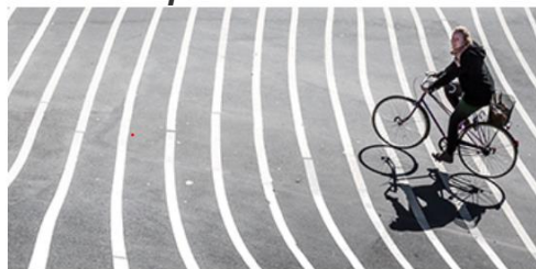
Mission, vision og målsætninger

For at komme ind på internetsiden, klik på billedet nedenfor: