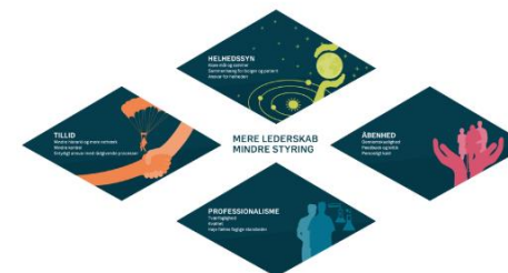
Mere lederskab, mindre styring