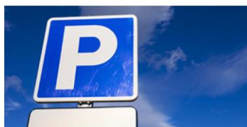
Transport og parkering