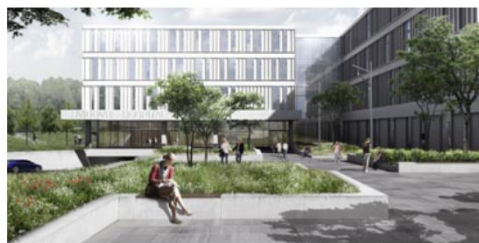
Byggeprojekt Nyt Hospital Hvidovre