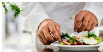
Kantiner og caféer