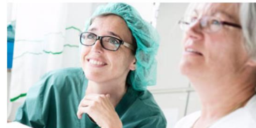
Kurser og uddannelse