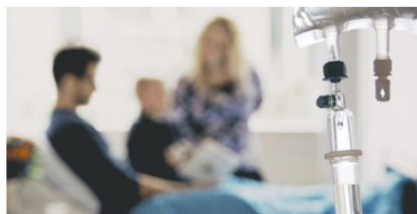
Det handler om liv