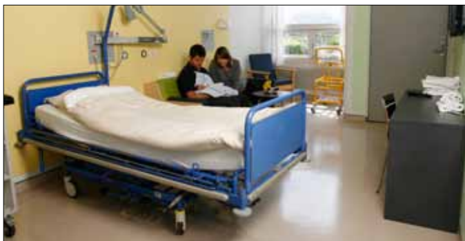
Værelser. Patienthotellet tilbyder eneværelser og dobbeltværelser med eget bad og toilet.