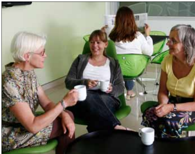
Lounge. Du kan invitere dine gæster med i den hyggelige lounge, hvor der også er internet, tv og aviser.

Check ud via receptionen senest kl. 10. Husk at aflevere dit nøglekort.