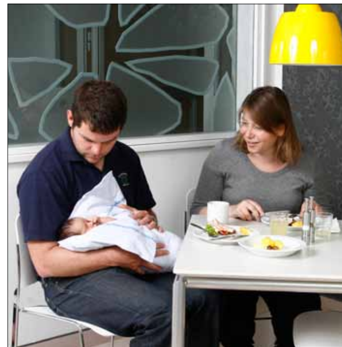
Café. I Patienthotellets café kan du spise sammen med dine gæster.

Rygning Hvidovre Hospital er røgfrit område, og det omfatter også værelserne på Patienthotellet.